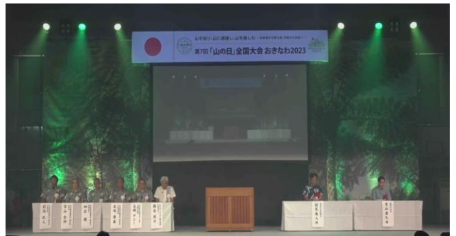
【第7回 沖縄大会 記念式典の様子】