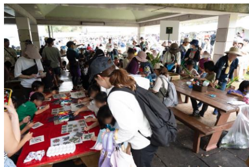
歓迎フェスティバル・ブース出展(沖縄大会)

ご協賛をいただける際は、『第8回「山の日」全国大会 TOKYO 2024 協賛申込書』を「山の日」全国大会運営事務局あてにご提出のほどお願いいたします。内容を確認させていただき、事務局より受理書をお送りさせていただきます。その後、協賛金を指定口座へ納入いただく手順となります。（物品協賛の場合は指定方法により、ご納品いただく手順となります。）